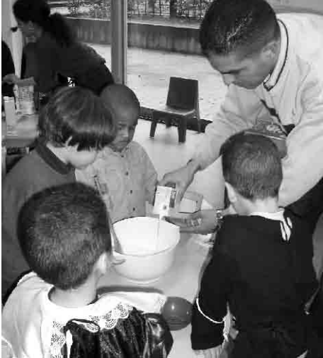
Diverses activitats a la Tanière des Petits Ours. A l'esq., els infants preparen crêpes. A la dreta, juguen a l'exterior, a l'interior, i fan una festa.