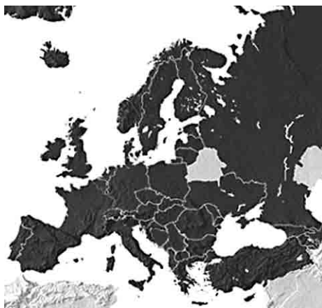
Els 45 països membres del Consell d'Europa